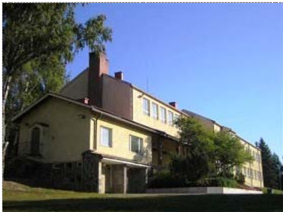
Ränkimäentie 2