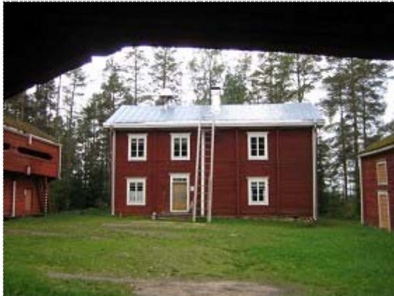
Ränkimäentie 6 (Kuva: Anne Ojanperä 07.09.09)