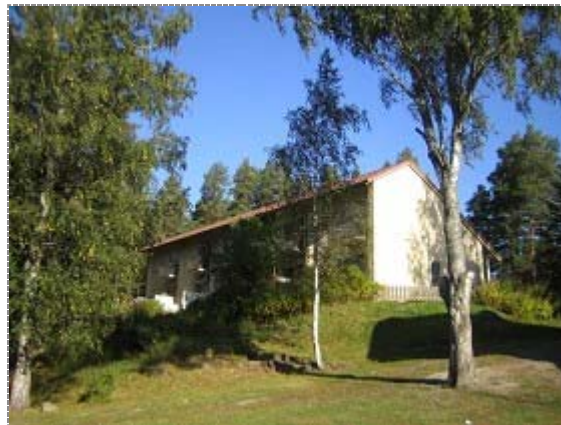
Ränkimäentie 2