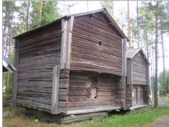
Ränkimäentie 6 (Kuva: Anne Ojanperä 07.09.09)